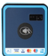
cVEND compact LTE